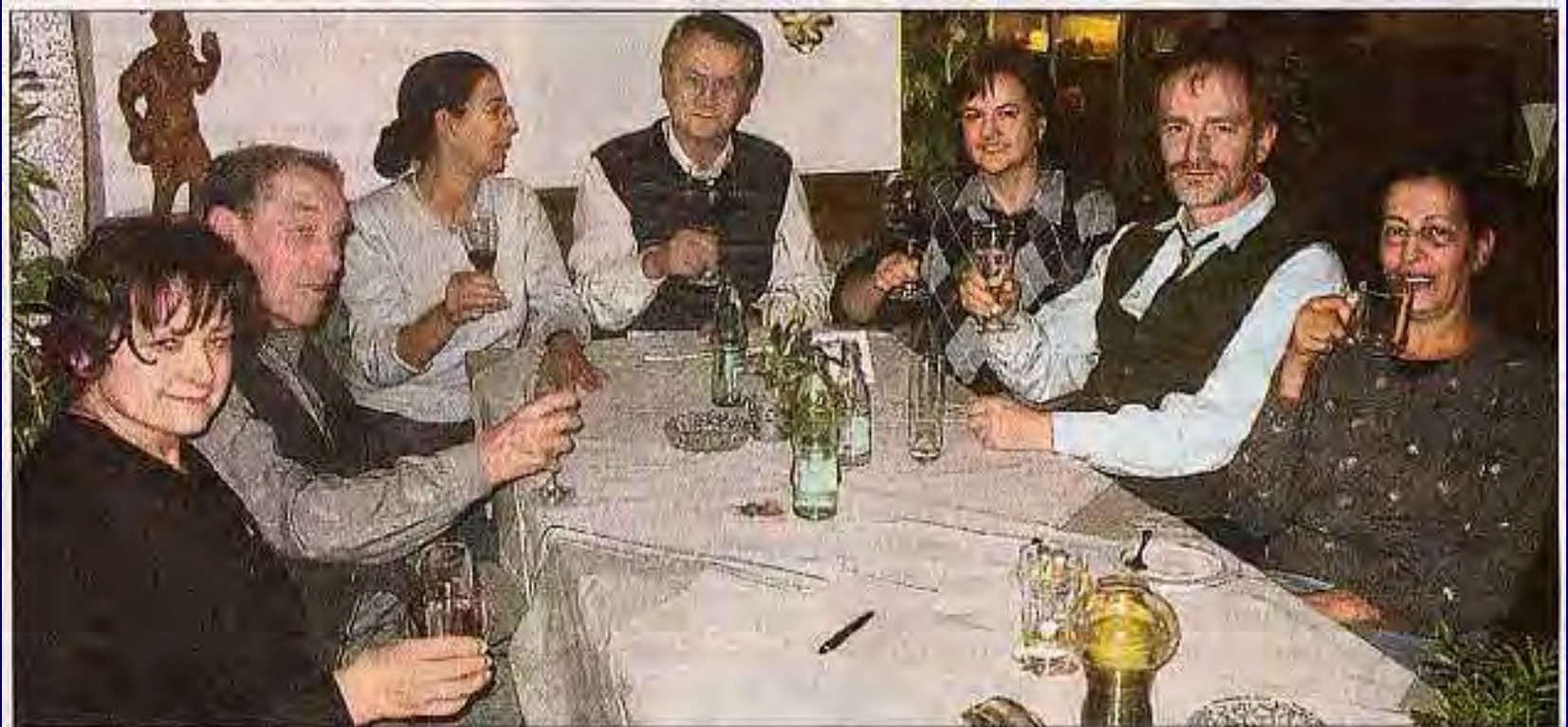
Ein ganz gewöhnlicher allwöchentlicher Stammtisch im Bad Säckinger „Viertel“ mit einem kleinen, aber feinen Unterschied: On parle français – man spricht französisch.