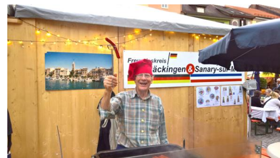
Stand des Freundeskreises am Brückenfest