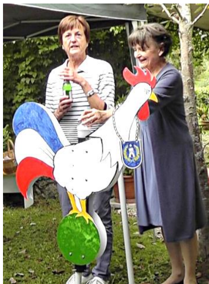
Taufe des Vereinsmaskottchens Jules

Zweck des Vereins ist es, im Rahmen der bestehenden Städtepartnerschaft zwischen den Städten Bad Säckingen und Sanary-sur-Mer aktiv für die Völkerverständigung zwischen Deutschen und Franzosen zu wirken, lebendige Kontakte zu pflegen, Begegnungen auf allen Ebenen zu fördern, zu koordinieren und dazu beizutragen, den abgeschlossenen Partnerschaftsvertrag mit Leben zu erfüllen.